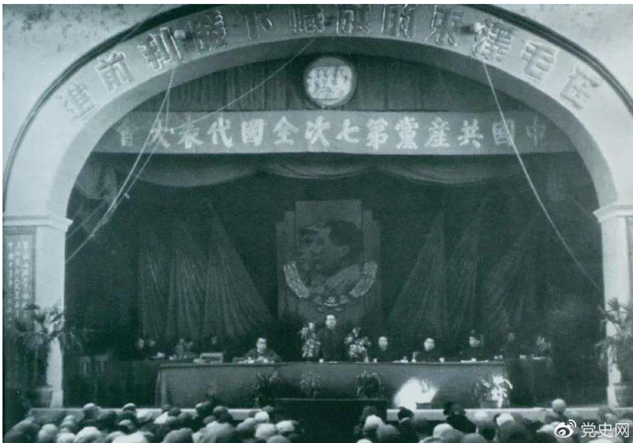
1945年4月23日，中国共产党第七次全国代表大会在延安举行。